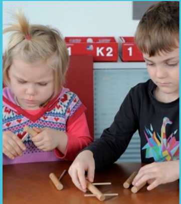
Materská škola 1

Obsahom workshopu je súhrn teoretických vedomostí a praktických zručností, ktoré zabezpečia pedagogickým zamestnancom v materskej škole orientovať sa v problematike využívania experimentálnych súprav MEKRUPHY pre materské školy vo výchovno-vzdelávacej činnosti.