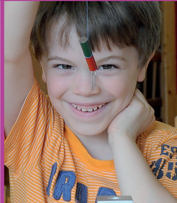
Materská škola 3