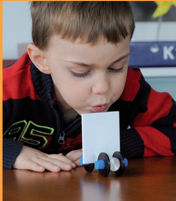
Materská škola 2