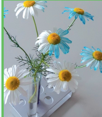
Materská škola 4